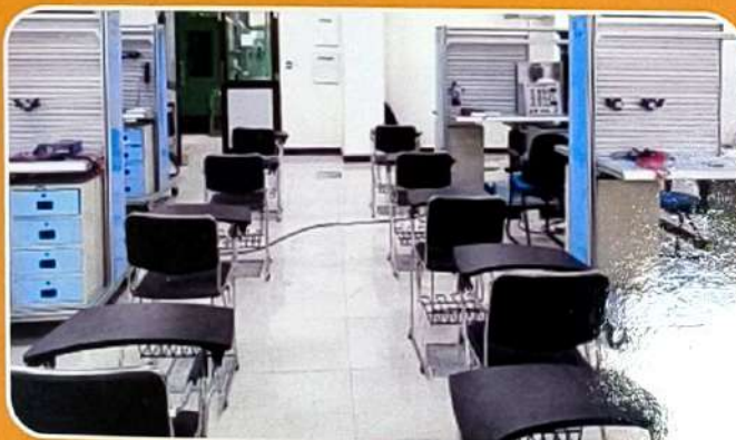
AUTOMATION HYDRAULIC LAB