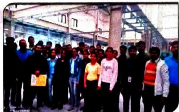
Industrial Visit of Students of Government ITI Kanpur