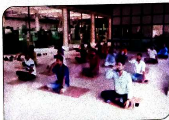
अन्तराष्ट्रीय योग दिवस