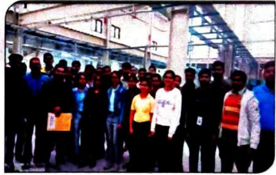
विद्यार्थियों का औद्योगिक भ्रमण राजकीय आईटीआई कानपुर