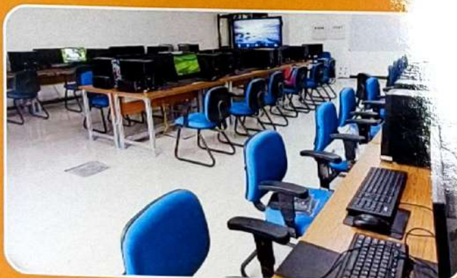
CAD / CAM LAB - 1