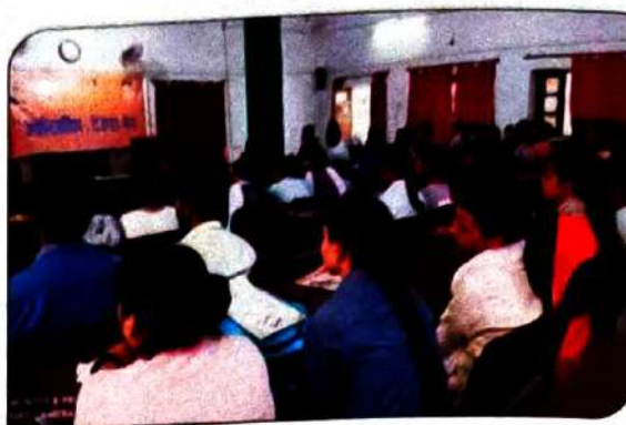
Conducting CNC Technology Awareness program at ITI Pandungar Kanpur