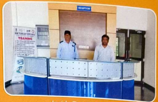
Inside Training block