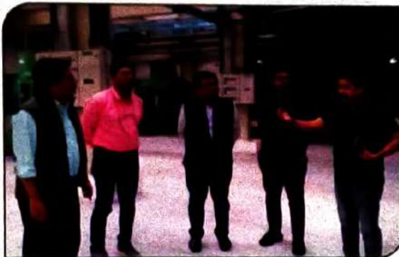
Visit of MD, Allenhouse Group of Institution under Superhouse Education Foundation