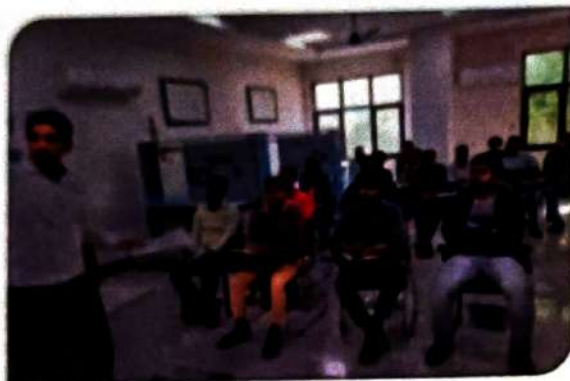
MDP under ESDP