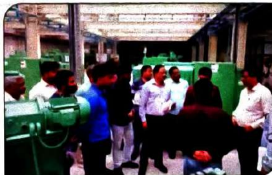
Visit of District Magistrate Kanpur to MSME TC Meeting with GM DIC Kanpur regarding exposure visit of college students to TC Kanpur.