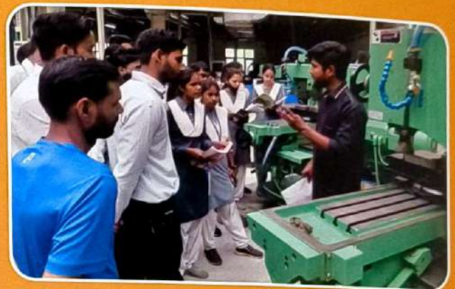
CONVENTIONAL MILLING MACHINE