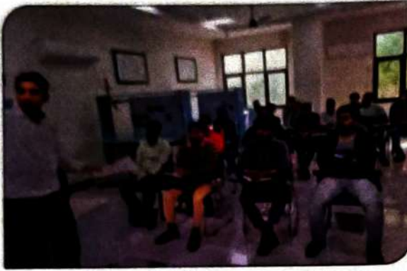
ईएसडीपी के तहत एमडीपी