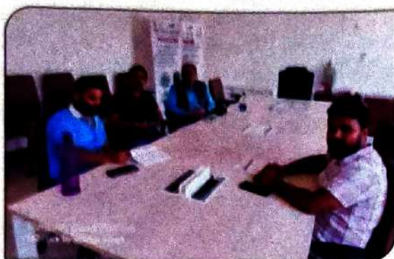
Visit of MD, Allenhouse Group of Institution & AGM Superhouse Education Foundation