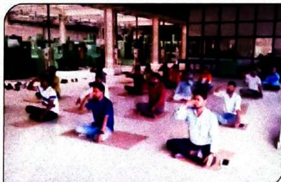
International Yoga Day