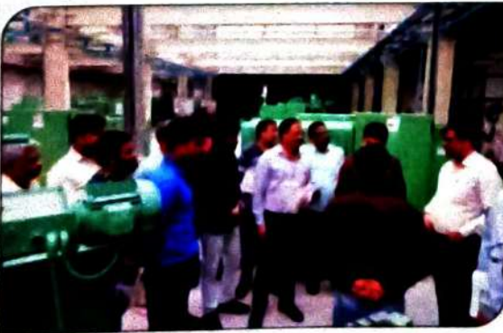
जिलाधिकारी कानपुर का एमएसएमई टीसी का दौरा