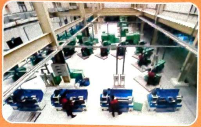
TRAINING BLOCK WORKSHOP