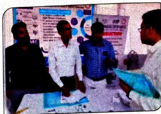
आजादी का अमृत महोत्सव