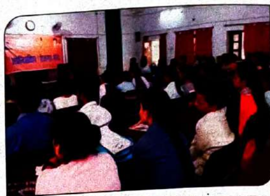
सीएनसी प्रौद्योगिकी जागरूकता का संचालन करना आईटीआई पांडुंगर कानपुर में कार्यक्रम