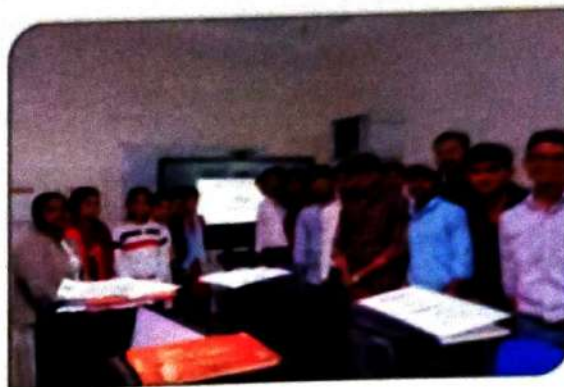
Short Term Course - CNC Milling