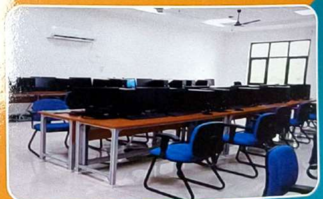
CAD /CAM LAB - 2