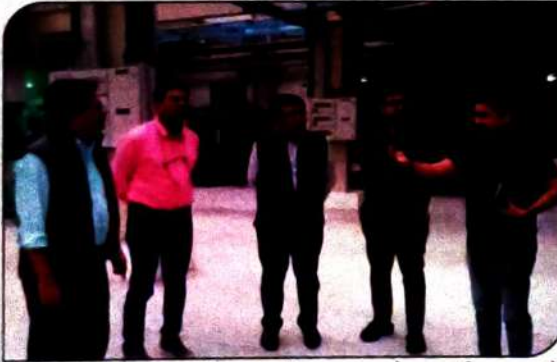
एलन हाउस ग्रुप ऑफ इंस्टीट्यूशन के एमडी का दौरा सुपर हाउस एजुकेशन फाउंडेशन के तहत