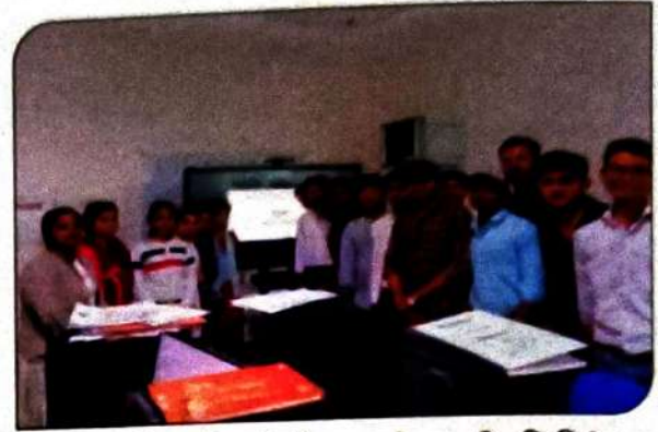
शॉर्ट टर्म कोर्स – सीएनसी मिलिंग