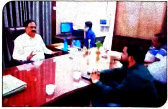
जीएम डीआईसी विद्यार्थियों का टीसी कानपुर भ्रमण के लिए डीएम कानपुर के साथ बैठक