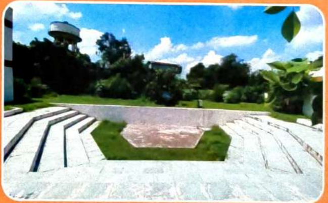
OPEN AIR THEATER