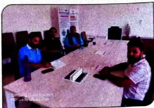
एलनहाउस ग्रुप ऑफ इंस्टीट्यूशन के एमडी का दौरा एजीएम सुपरहाउस एजुकेशन फाउंडेशन