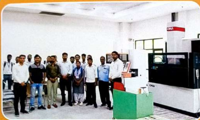
CNC EDM LAB