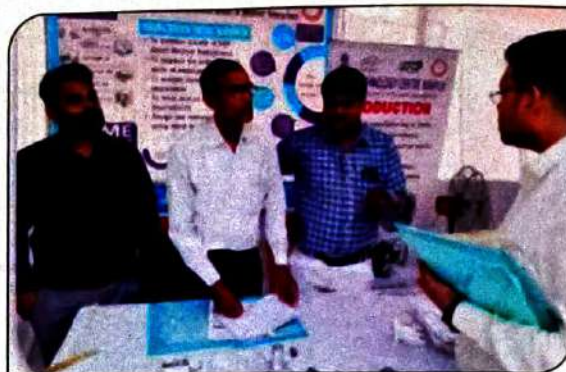
Azadi Ka Amrit Mahotsav